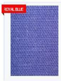
FINE JUTE FABRICS (FJF) 13X13 BDT 0 PER YARD/S