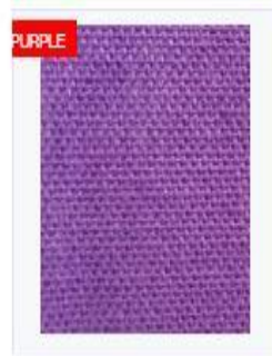
FINE JUTE FABRICS (FJF) 13X13 BDT 0 PER YARD/S