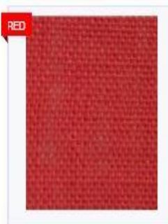
FINE JUTE FABRICS (FJF) 13X13 BDT 0 PER YARD/S