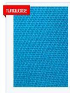
FINE JUTE FABRICS (FJF) 13X13 BDT 0 PER YARD/S

Activate Windows Go to Settings to activate Windows.