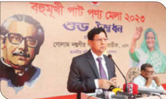
বহুমুখী পাটপণ্যের একক মেলা