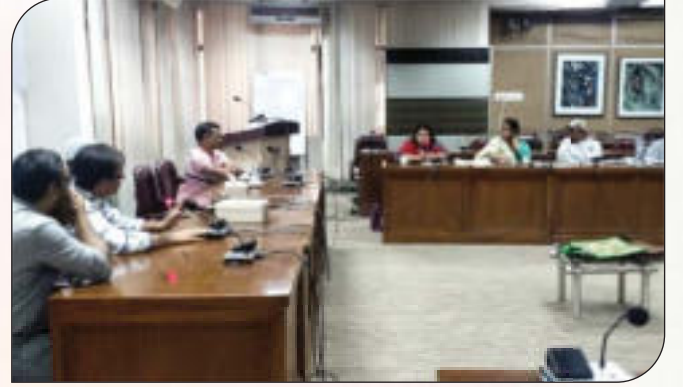
ত্রৈমাসিক ভিত্তিতে সেবা প্রদান প্রতিশ্রুতি (সিটিজেন চার্টার) সংক্রান্ত পরিবীক্ষণ কমিটির সভা