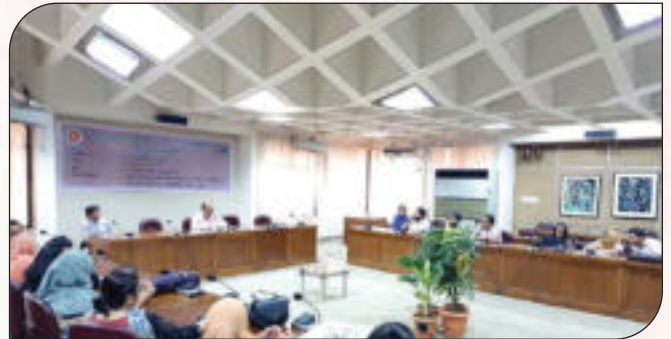
তথ্য অধিকার আইন ও বিধিবিধান সম্পর্কে জনসচেতনতা বৃদ্ধিকরণ