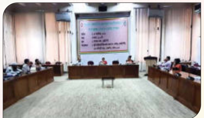
কর্মকর্তা-কর্মচারীদের অংশগ্রহণে জাতীয় শুদ্ধাচার কর্মপরিকল্পনা বাস্তবায়ন বিষয়ে প্রশিক্ষণ