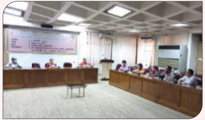
ই-গভর্ন্যান্স ও উদ্ভাবন কর্মপরিকল্পনা বাস্তবায়ন সংক্রান্ত প্রশিক্ষণ