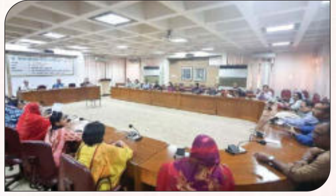
সেবা প্রদান প্রতিশ্রুতি (সিটিজেন চার্টার) বিষয়ে স্টেকহোল্ডারদের সমন্বয়ে অবহিতকরণ সভা