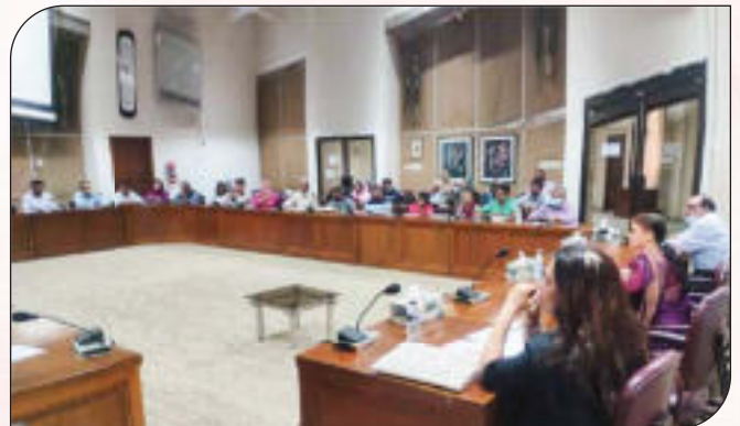
সুশাসন প্রতিষ্ঠার নিমিত্ত অংশীজনের (Stakeholders) অংশগ্রহণে সভা