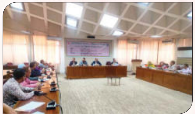
ই-গভর্ন্যান্স ও উদ্ভাবন কর্মপরিকল্পনা বাস্তবায়ন সংক্রান্ত প্রশিক্ষণ