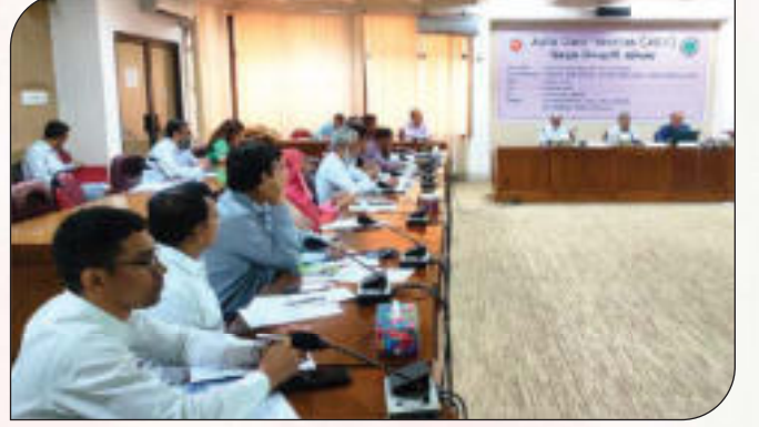
জুট জিও-টেক্সটাইলের ব্যবহার বৃদ্ধির জন্য স্টেক হোল্ডারদের সাথে সভা