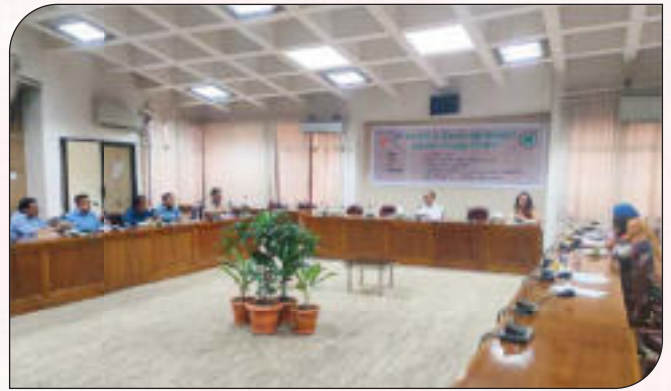
ই-গভর্ন্যান্স ও উদ্ভাবন কর্মপরিকল্পনা বাস্তবায়ন সংক্রান্ত প্রশিক্ষণ