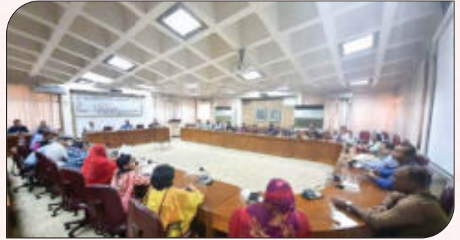
অভিযোগ প্রতিকার ব্যবস্থাপনা (GRS) বিষয়ে স্টেকহোল্ডারদের সমন্বয়ে অবহিতকরণ সভা