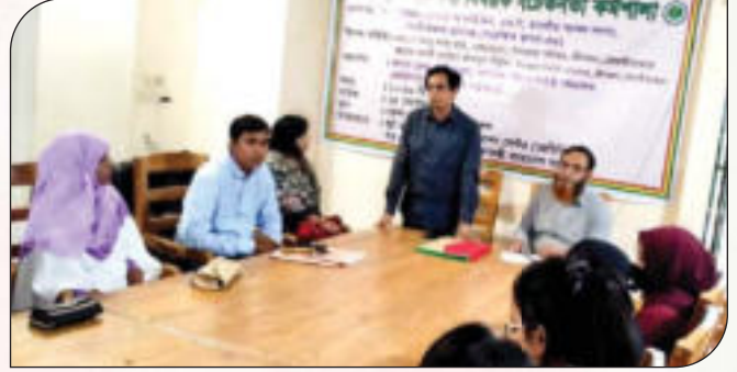
তথ্য অধিকার আইন ও বিধিবিধান সম্পর্কে জনসচেতনতা বৃদ্ধিকরণ