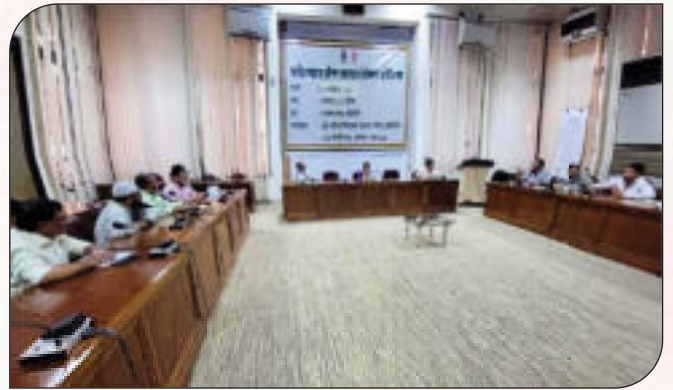
জাতীয় শুদ্ধাচার কৌশল বাস্তবায়নে নৈতিকতা কমিটির সভা