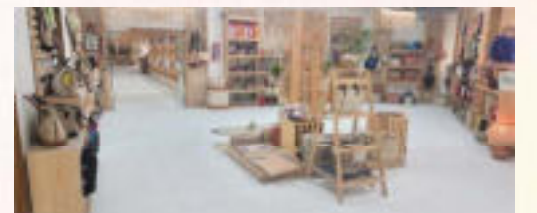
প্রদর্শনী ও বিক্রয় কেন্দ্র