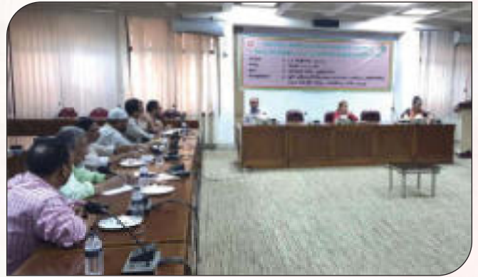
ই-গভর্ন্যান্স ও উদ্ভাবন কর্মপরিকল্পনা বাস্তবায়ন সংক্রান্ত প্রশিক্ষণ