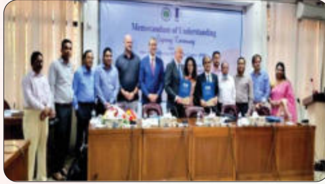
জেডিপিসি ও CBI এর মধ্যে সমঝোতা চুক্তি স্বাক্ষর অনুষ্ঠানের গ্রুপ ছবি