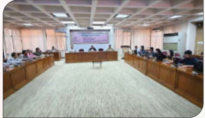
৪র্থ শিল্প বিপ্লব (4IR) এর চ্যালেঞ্জ মোকাবেলায় সেবাসমূহ ডিজিটাইজেশন বিষয়ক কর্মশালা