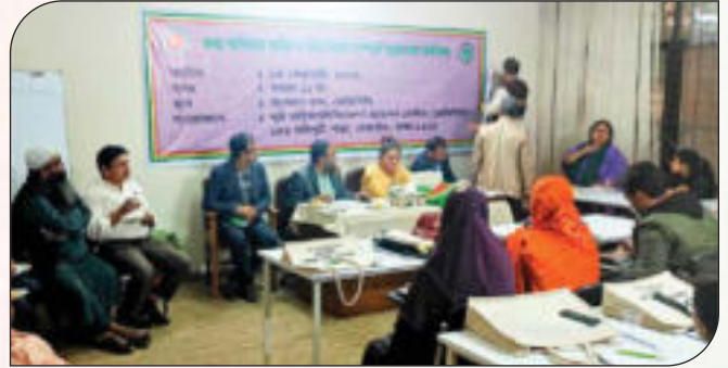
তথ্য অধিকার আইন ও বিধিবিধান সম্পর্কে জনসচেতনতা বৃদ্ধিকরণ