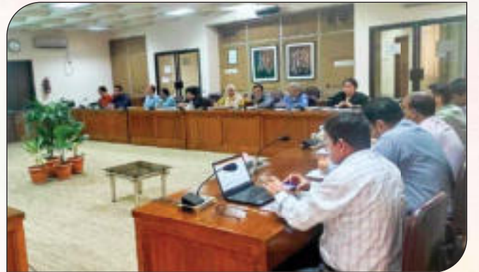
৪র্থ শিল্প বিপ্লব (4IR) এর সম্ভাব্য চ্যালেঞ্জ মোকাবেলায় জেডিপিসি'র কর্মকর্তা/কর্মচারীদের অংশগ্রহণে কর্মশালা

উক্ত কর্মপরিকল্পনা অনুযায়ী “উদ্যোক্তাদের আধুনিক মিল/কারখানা পরিদর্শন” কার্যক্রমের অংশ হিসাবে গত ২০ এপ্রিল ২০২৩ তারিখ বৃহস্পতিবার জেডিপিসি'র ইনোভেশন টিমের উদ্যোগে ইনোভেশন ফোকাল পয়েন্ট কর্মকর্তাসহ টিমের সদস্যগণ ফরিদপুর জেলার বাখুন্ডা বাজারে অবস্থিত ‘জোবাইদা করিম জুট মিল’ পরিদর্শন করেন।