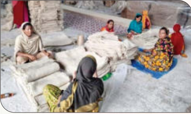
মিলে কর্মরত মহিলা শ্রমিক