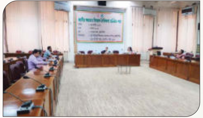
জাতীয় শুদ্ধাচার কৌশল বিষয়ে নৈতিকতা কমিটির সভা