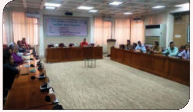
কর্মকর্তা-কর্মচারীদের অংশগ্রহণে জাতীয় শুদ্ধাচার (NIS) কর্মপরিকল্পনা বাস্তবায়ন বিষয়ে প্রশিক্ষণ