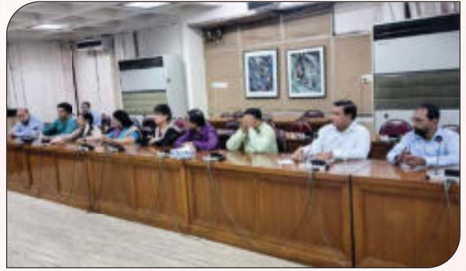
অভিযোগ প্রতিকার ব্যবস্থাপনা (GRS) বিষয়ে স্টেকহোল্ডারদের সমন্বয়ে অবহিতকরণ সভা