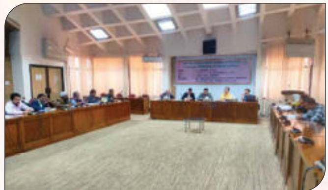
৪র্থ শিল্প বিপ্লব (4IR) এর চ্যালেঞ্জ মোকাবেলায় সেবাসমূহ ডিজিটাইজেশন বিষয়ক কর্মশালা