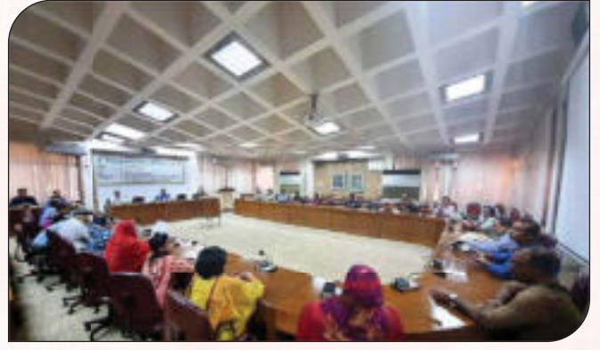
সুশাসন প্রতিষ্ঠার নিমিত্ত অংশীজনের (Stakeholders) অংশগ্রহণে সভা