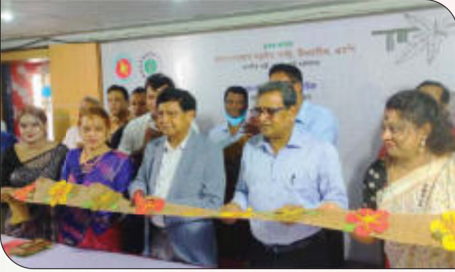
বহুমুখী পাটপণ্যের একক মেলা