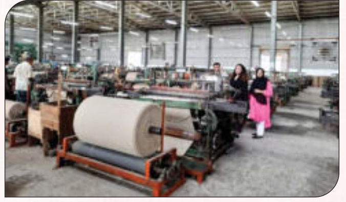
৪র্থ শিল্প বিপ্লব (4IR) এর সম্ভাব্য চ্যালেঞ্জ মোকাবেলায় উদ্যোক্তাদের আধুনিক মিল/কারখানা পরিদর্শন