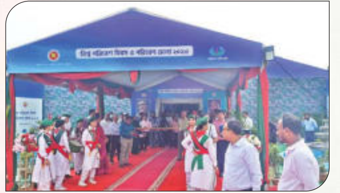
পরিবেশ মেলা -২০২৩