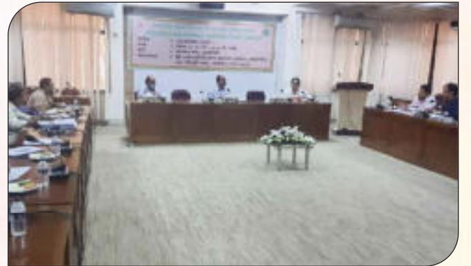
সেবা প্রদান প্রতিশ্রুতি (সিটিজেন চার্টার) বিষয়ে প্রশিক্ষণ