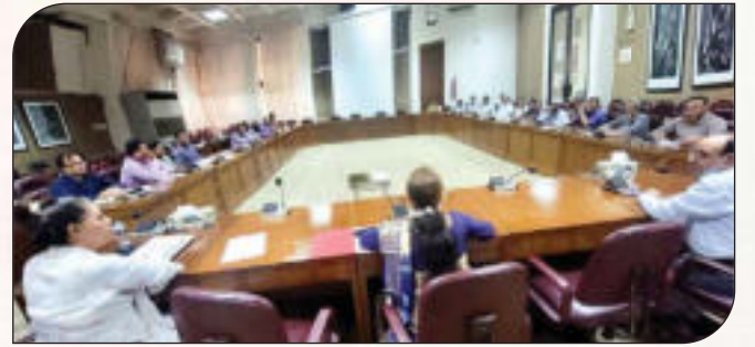
অভিযোগ প্রতিকার ব্যবস্থাপনা (GRS) সফটওয়্যার বিষয়ে প্রশিক্ষণ