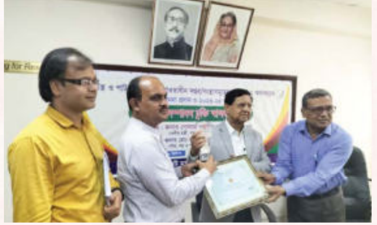
বার্ষিক কর্মসম্পাদন চুক্তি বাস্তবায়নে ২য় স্থান অর্জনের স্বীকৃতিস্বরূপ সম্মাননাপত্র

জেডিপিসি দক্ষতার সঙ্গে বার্ষিক কর্মসম্পাদন চুক্তি (APA) বাস্তবায়ন করে আসছে। ২০২১-২০২২ অর্থবছরের বার্ষিক কর্মসম্পাদন চুক্তি দক্ষতার সঙ্গে বাস্তবায়নে ২য় স্থান অর্জনের স্বীকৃতিস্বরূপ সম্মাননাপত্র প্রদান করে বস্ত্র ও পাট মন্ত্রণালয়।