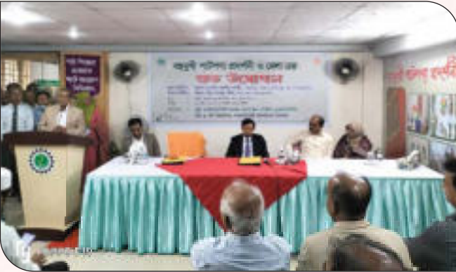
বহুমুখী পাটপণ্যের একক মেলা