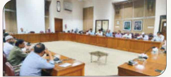
অভিযোগ প্রতিকার ব্যবস্থাপনা (GRS) সফটওয়্যার বিষয়ে প্রশিক্ষণ