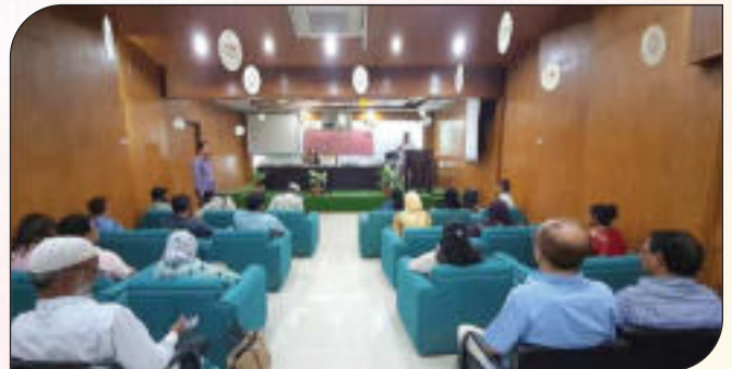
তথ্য অধিকার আইন ও বিধিবিধান সম্পর্কে জনসচেতনতা বৃদ্ধিকরণ