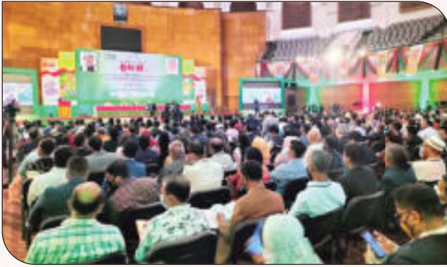
১০ম জাতীয় এসএমই পণ্য মেলা-২০২২