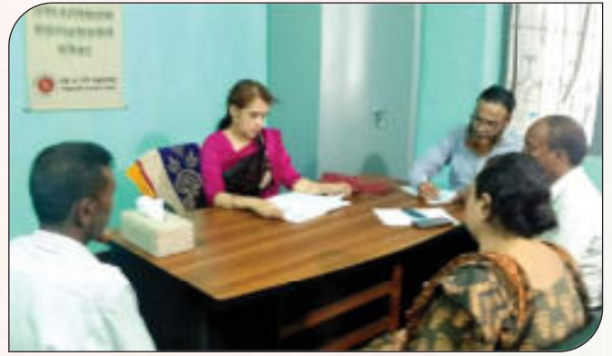
জাতীয় শুদ্ধাচার কৌশল কর্মপরিকল্পনা বাস্তবায়ন বিষয়ে সভা