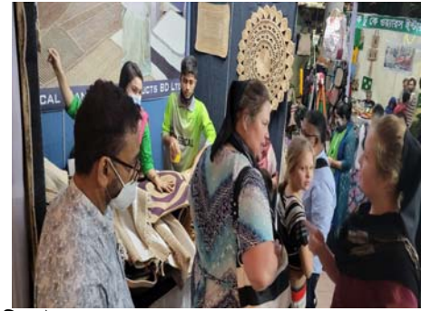
জাতীয় পাট দিবস উপলক্ষে বহুমুখী পাটপণ্যের একক মেলা