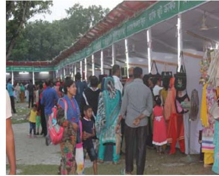
কক্সবাজার বহুমুখী পাটপণ্যের একক মেলা