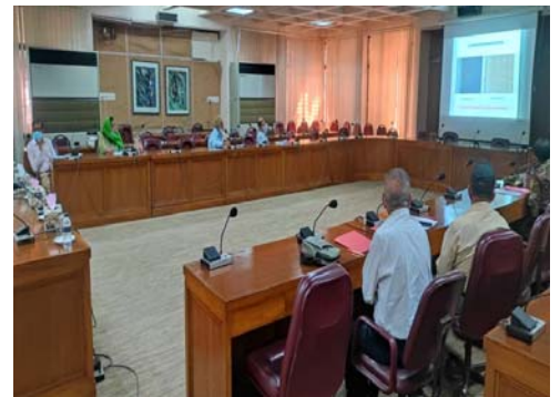
জুট জিও-টেক্সটাইলের ব্যবহার বৃদ্ধির জন্য স্টেক হোল্ডারদের সাথে সভা