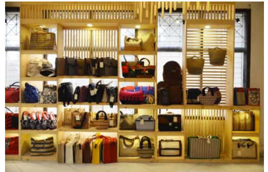
প্রদর্শনী ও বিক্রয় কেন্দ্র