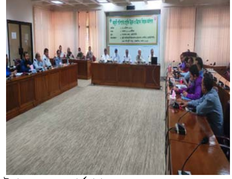
বহুমুখী পাটপণ্যের প্রযুক্তিগত ও উদ্ভাবনমূলক ওয়ার্কশপ