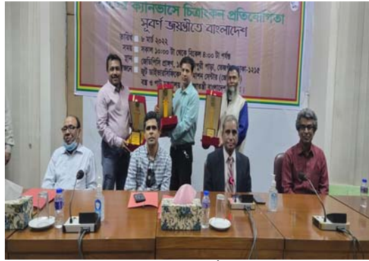
বঙ্গবন্ধুর স্মরণে অ্যাওয়ার্ড/ সম্মাননা প্রদান