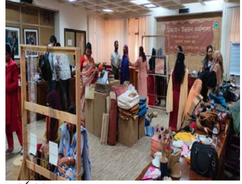
ডিজাইন উন্নয়ন ওয়ার্কশপ