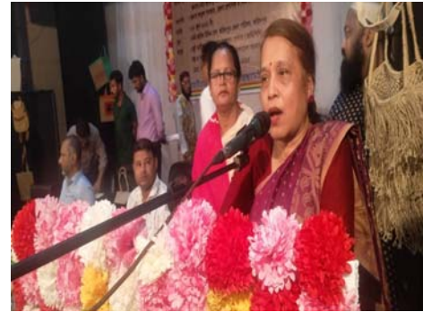
উদ্যোক্তা উন্নয়ন প্রশিক্ষণ