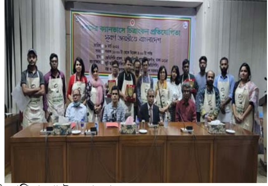
বঙ্গবন্ধু স্মরণে চিত্রাংকন প্রতিযোগিতা (পাটের ক্যানভাসে)