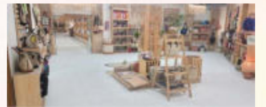
প্রদর্শনী ও বিক্রয় কেন্দ্র