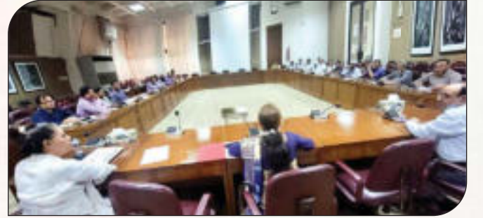
অভিযোগ প্রতিকার ব্যবস্থাপনা (GRS) সফটওয়্যার বিষয়ে প্রশিক্ষণ