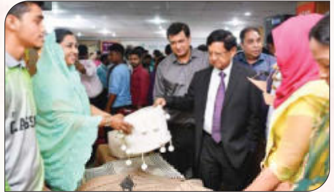
বহুমুখী পাটপণ্যের একক মেলা