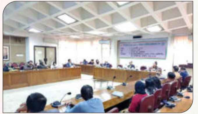
৪র্থ শিল্প বিপ্লব (4IR) এর সম্ভাব্য চ্যালেঞ্জ মোকাবেলায় জেডিপিসি'র উদ্যোক্তাদের অবহিতকরণ সভা

৪র্থ শিল্প বিপ্লবের সম্ভাব্য চ্যালেঞ্জ মোকাবেলায় বস্ত্র ও পাট মন্ত্রণালয়ের ইনোভেশন টিম ও এটুআই এর প্রতিনিধির পরিচালনায় জেডিপিসি'র কর্মকর্তা/কর্মচারীদের অংশগ্রহণে দিনব্যাপী কর্মশালা গত ৫ এপ্রিল ২০২৩ তারিখে অনুষ্ঠিত হয়।