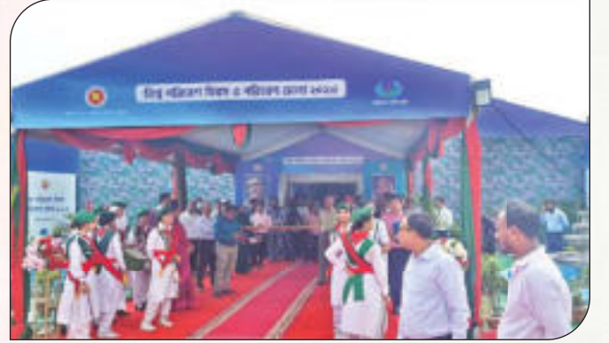
পরিবেশ মেলা -২০২৩