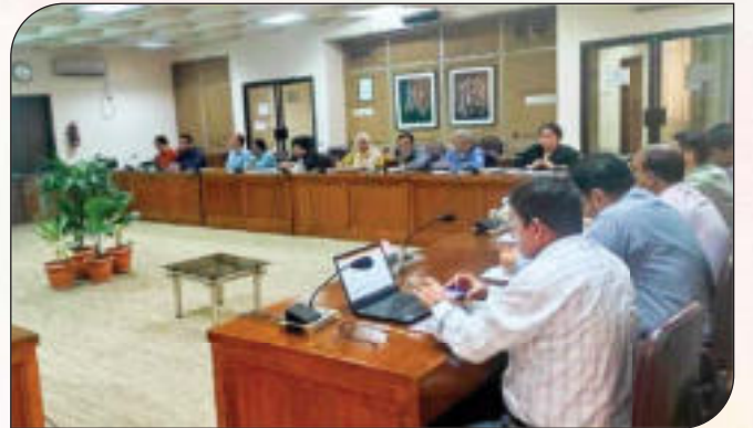
৪র্থ শিল্প বিপ্লব (4IR) এর সম্ভাব্য চ্যালেঞ্জ মোকাবেলায় জেডিপিসি'র কর্মকর্তা/কর্মচারীদের অংশগ্রহণে কর্মশালা

উক্ত কর্মপরিকল্পনা অনুযায়ী “উদ্যোক্তাদের আধুনিক মিল/কারখানা পরিদর্শন” কার্যক্রমের অংশ হিসাবে গত ২০ এপ্রিল ২০২৩ তারিখ বৃহস্পতিবার জেডিপিসি'র ইনোভেশন টিমের উদ্যোগে ইনোভেশন ফোকাল পয়েন্ট কর্মকর্তাসহ টিমের সদস্যগণ ফরিদপুর জেলার বাখুন্ডা বাজারে অবস্থিত ‘জোবাইদা করিম জুট মিল’ পরিদর্শন করেন।