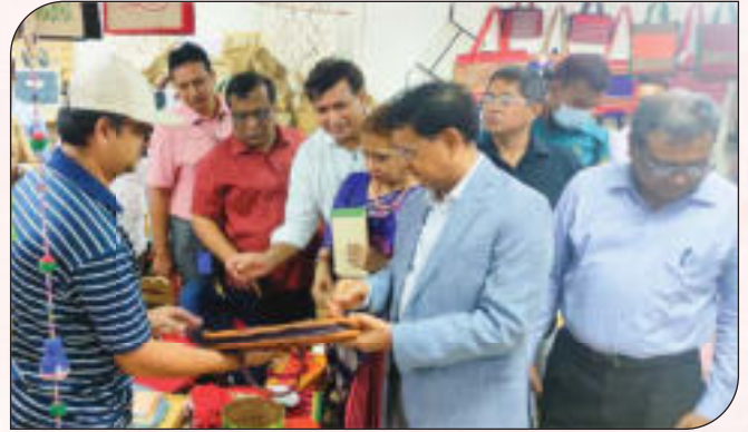
বহুমুখী পাটপণ্যের একক মেলা