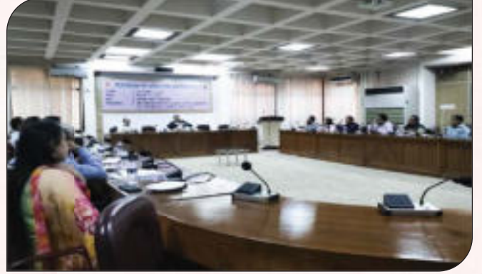
উদ্যোক্তাদের মূলধন সংগ্রহ বিষয়ক অংশীজন সভা