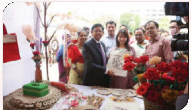
বহুমুখী পাটপণ্যের একক মেলা